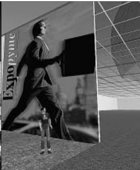
La empresa Novaspac ha desarrollado el espacio de Expopyme 2007 en Second Life.

De esta manera, Expopyme 2007 llega al ciberespacio gracias a Second Life. En este mundo virtual quienes no puedan acercarse a Zaragoza los días 16, 17 y 18 de octubre podrán acceder a la feria a través de Internet. El sistema para hacerlo pasa por crear un personaje virtual en la web de Second Life. Tras esto sólo hay que descargar el programa e instalarlo en