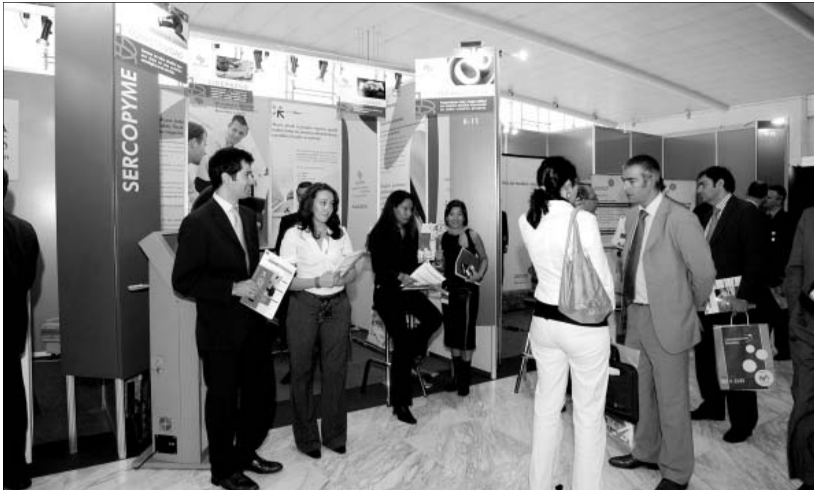
Imagen de la primera edición de Expopyme, celebrada en el Palacio de Congresos de Madrid, en septiembre de 2006.